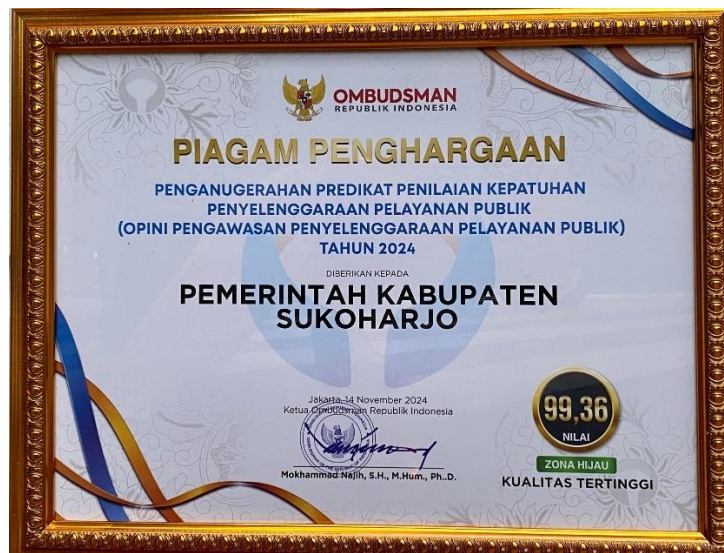
Gambar III.F.6 Opini Pengawasan Penyelenggaraan Pelayanan Publik oleh Ombudsman RI

Capaian ini adalah buah dari komitmen kuat seluruh pemangku kepentingan yaitu Bupati Sukoharjo, seluruh Perangkat Daerah yang dijadikan lokus penilaian yaitu Dinas Kependudukan dan Pencatatan Sipil, Dinas PM dan PTSP, Dinas Kesehatan, Dinas Sosial, Dinas Pendidikan dan Kebudayaan, Puskesmas Kartasura, Puskesmas Sukoharjo dan Bagian Organisasi Setda Kab. Sukoharjo untuk menyelenggarakan dan menghadirkan pelayanan publik yang prima dan sesuai dengan peraturan perundang-undangan.