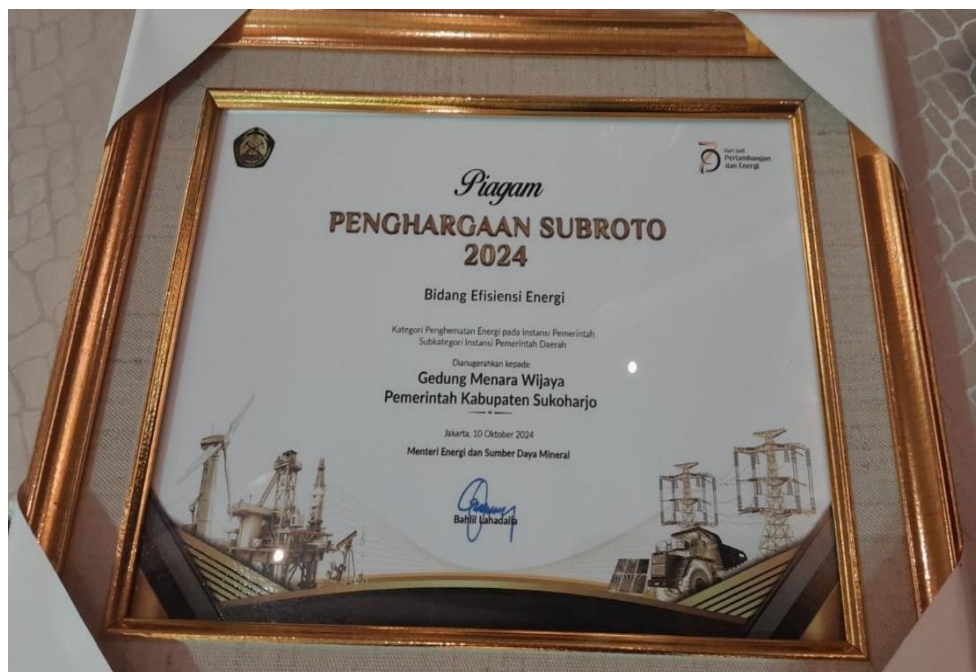
Gambar III.F.4 Penghargaan Subroto dari Kementerian ESDM

Penghargaan Subroto Award merupakan kegiatan untuk memberikan penghargaan kepada para institusi pemerintah dan pemangku kepentingan di sektor bangunan dan industri sehubungan dengan upaya-upaya efisiensi dan konsevasi energi terbaik yang telah diterapkan di lingkungannya. Pada tahun 2024 Pemerintah Daerah Kabupaten Sukoharjo mengikuti Ajang Penghargaan Subroto Award bidang Efisiensi Energi Kategori Penghematan Energi pada instansi pemerintah Sub Kategori Pemerintah Daerah dengan mengajukan Bangunan Gedung Menara Wijaya Kabupaten Sukoharjo sebagai bangunan gedung yang melakukan uapaya penghematan energi dan berhasil memperoleh penghargaan Subroto Award Tahun 2024 Bidang Efisiensi atau Efisiensi Energi Kategori Penghematan Energi pada Instansi Pemerintah Sub Kategori Pemerintah Daerah . Penghargaan Subroto Award diserahkan oleh Menteri Energi dan SDM Mineral RI pada tanggal 10 Oktober 2024 dan disaksikan oleh Presiden Republik Indonesia.