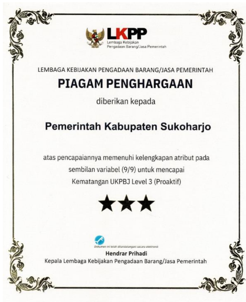
Gambar III.F.8 Capaian Tingkat Kematangan UKPBJ