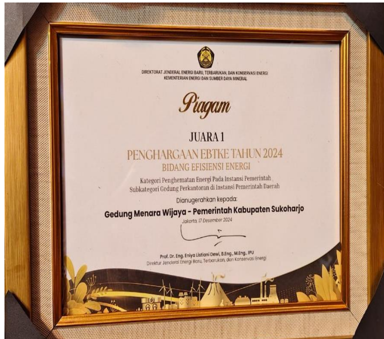
Gambar III.F.5 Penghargaan EBTKE dari Direktorat Jenderal Energi Baru, Terbarukan dan Konservasi Energi

6. Penganugerahan Predikat Penilaian Kepatuhan Penyelenggaraan Pelayanan Publik (Opini Pengawasan Penyelenggaraan Pelayanan Publik) Tahun 2024 Pemerintah Kabupaten Sukoharjo berhasil memperoleh Peringkat 2 Nasional Penganugerahan Predikat Penilaian Kepatuhan Penyelenggaraan Pelayanan Publik (Opini Pengawasan Penyelenggaraan Pelayanan Publik) Tahun 2024 yang diselenggarakan oleh Ombudsman Republik Indonesia dengan perolehan nilai sebesar 99,36 Zona Hijau Opini Kualitas Tertinggi (A). Perolehan nilai tersebut naik secara signifikan dari tahun ketahun, dimana pada Tahun 2022